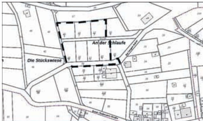
Lageplan mit Geltungsbereich (schwarz gestrichelt) des Bebauungsplans „An der Schlaufe“ - Gemeinde Floh-Seligenthal (Kartengrundlage „Geoproxy“ Thüringen)

Floh-Seligenthal, den 25.09.2014 Ralf Holland-Nell, Bürgermeister