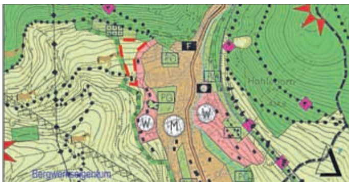
Auszug aus dem rechtskräftigen Flächennutzungsplan der Gemeinde Floh-Seligenthal mit Bereich der 4. Änderung (rot gestrichelt)

Floh-Seligenthal, den 25.09.2014 Ralf Holland-Nell, Bürgermeister