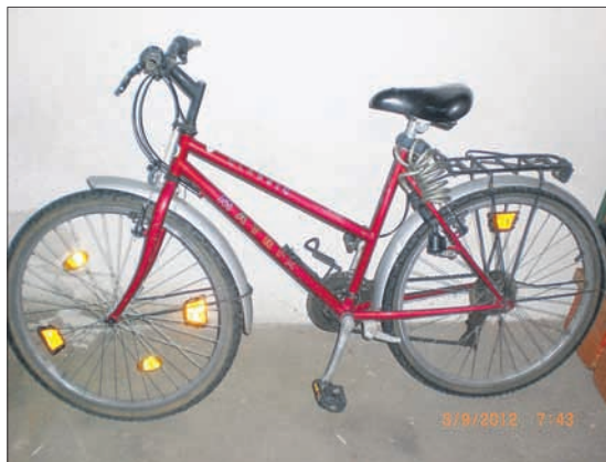
Damenfahrrad Marke: Classic Matrix Farbe: rot

Im Fundbüro wurde ein Fahrrad abgegeben. Unter Vorlage eines Eigentumsnachweises kann dieses durch den Eigentümer abgeholt werden.